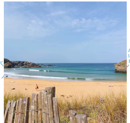
Plage de Donnant