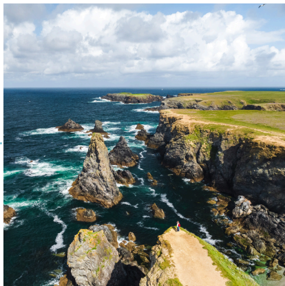
Les Aiguilles de Port Coton