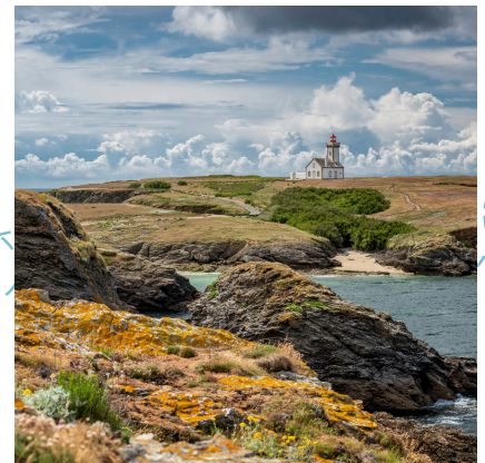
Pointe des Poulains