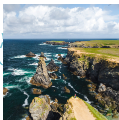
Aiguilles de Port Coton