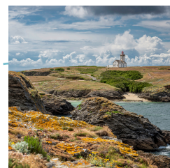
Pointe des Poulains