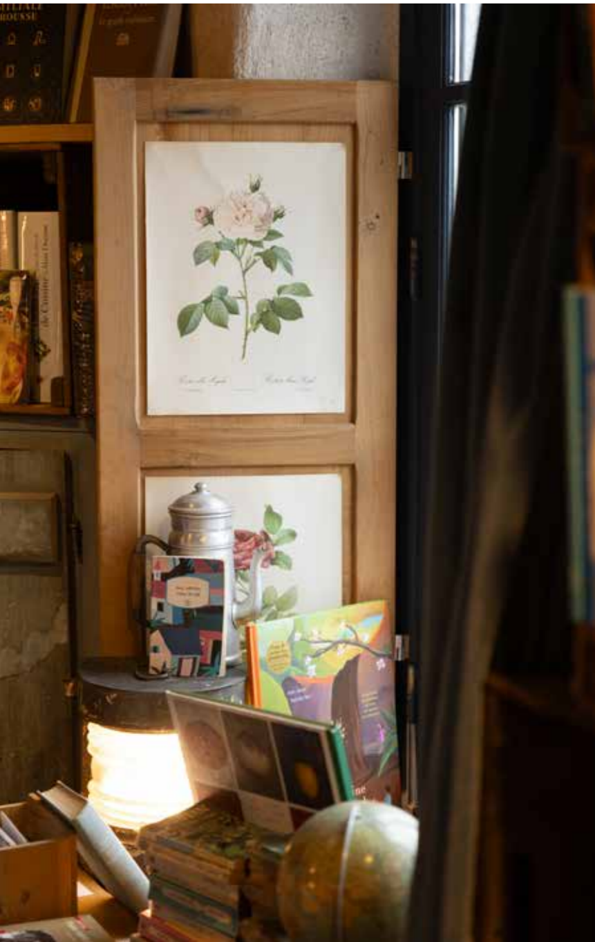
Le Liber & Co est une véritable caverne d'Ali Baba. L'œil est sans cesse attiré par un livre, un objet...